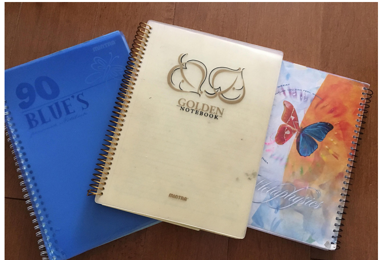
Three diaries.