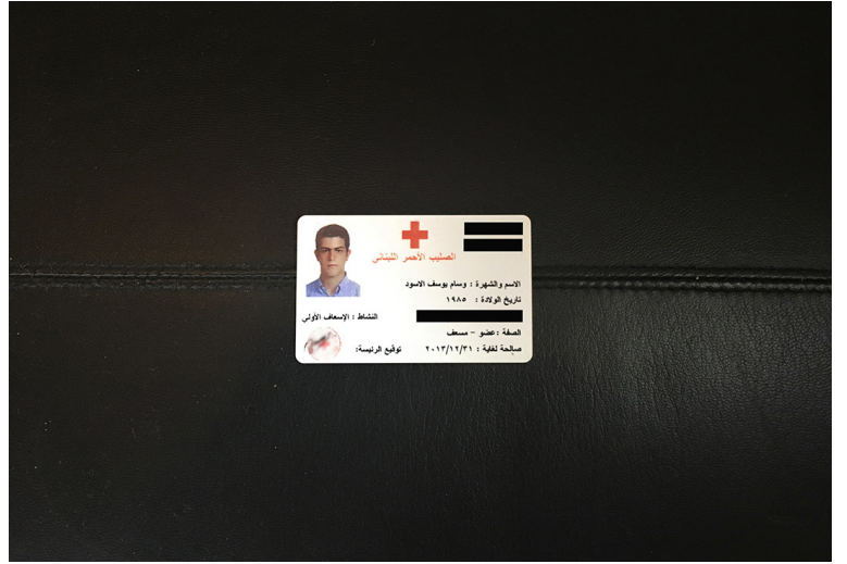
بطاقة صليب أحمر.

الدخول مجاني / الصالة تتيح الدخول بواسطة الكرسي المتحرك